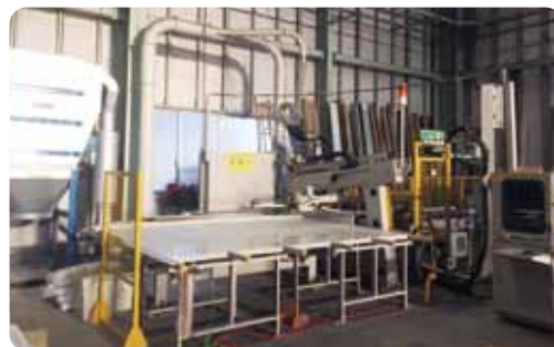
宮川工機 MPD-13 サイディングフルプレカット加工機

山西は木造プレカット工場内に、サイディングプレカット加工専用の最新鋭加工機を配備して、現場の問題を解決します。